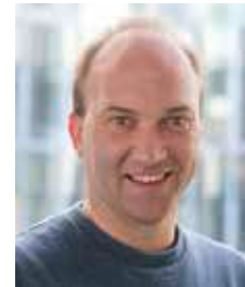
Chefredakteur: Marco Theimer -150