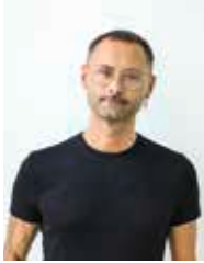
Chefredakteur: Michael Teodorescu -175