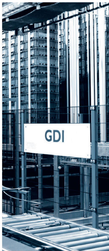
LAGERN & SORTIEREN